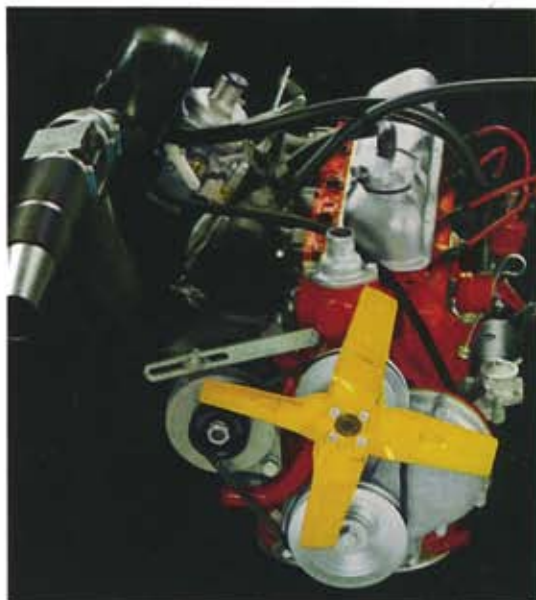
B 20 A. 2 liters, 4-cylindrig, 90 hk SAE. Avgasrening som standard.

Volvos kvalitet och slitstyrka bidrar till låga bilkostnader och högt andrahandsvärde. Dessutom har Volvo 164, 140-serien och Amazonmodellerna Volvos 5-åriga PV-garanti — ingen extra kostnad för vagnskadeförsäkring. Alla Volvo-ägare har dessutom tillgång till speciella försäkringsförmåner genom Volvia, Volvos eget försäkringsbolag.