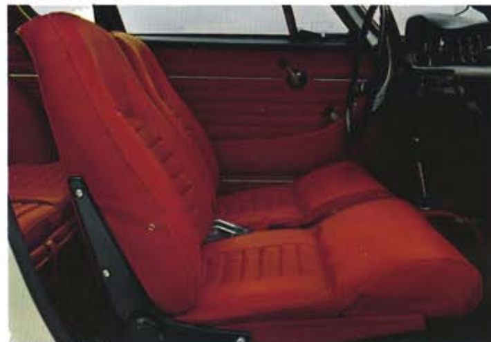
Volvo 1800 S