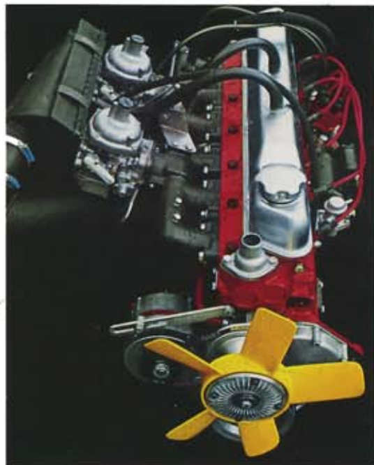
B 30. 3 liters, 6-cylindrig, 145 hk SAE. Avgasrening som standard.